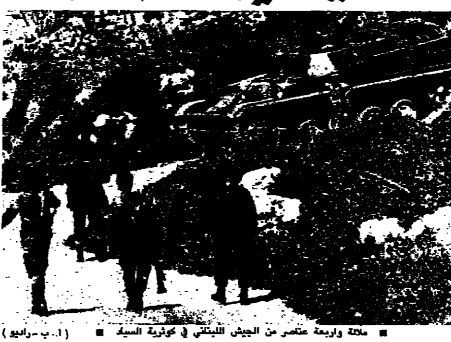
ملاحة واربعة عناصر من الجيش اللبناني في كوتريّة السيّد